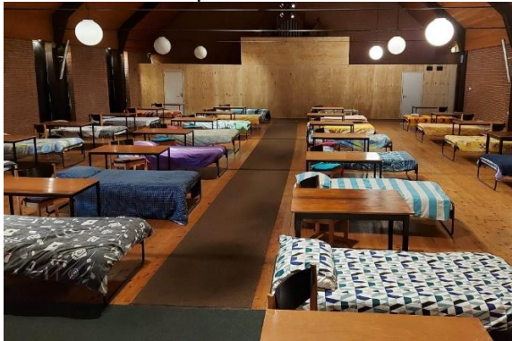
Slaapzaal in kerk